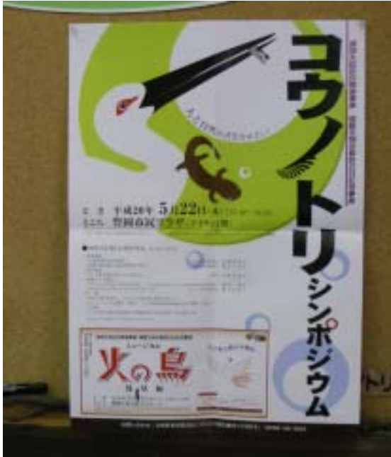
写真1 コウノトリシンポジウムのポスター