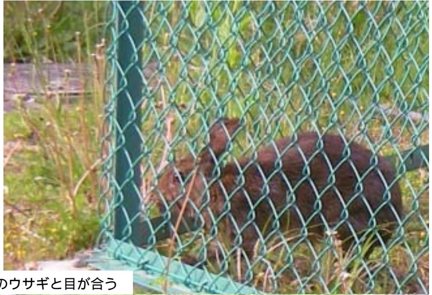
写真7 フェンスの外のウサギと目が合う