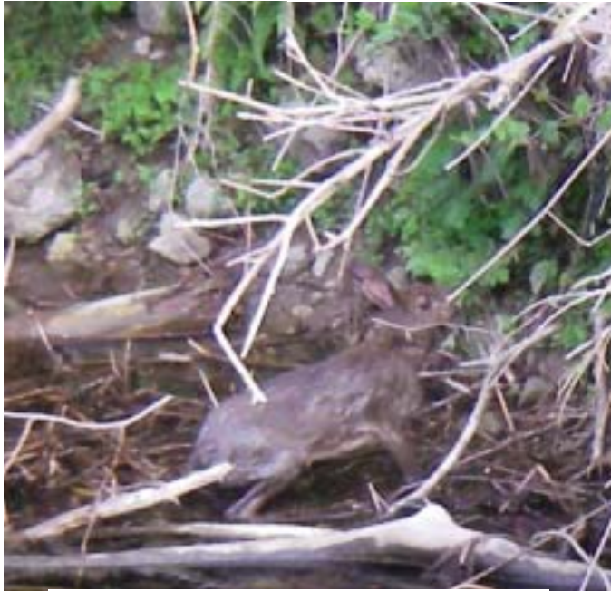
写真9 対岸に泳ぎ着いた濡れウサギ