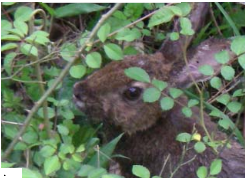
写真10 藪に隠れて・・・