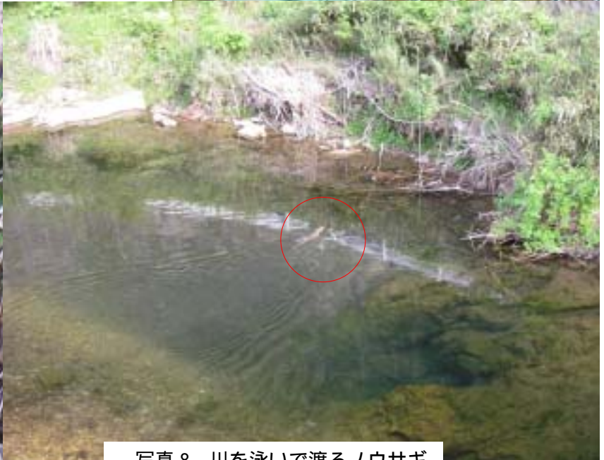
写真8 川を泳いで渡るノウサギ