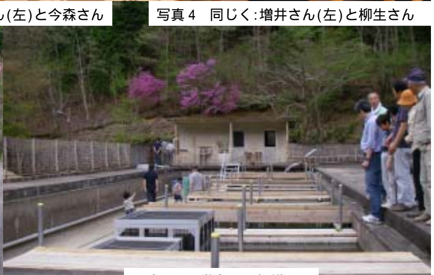
写真6 見学者への解説