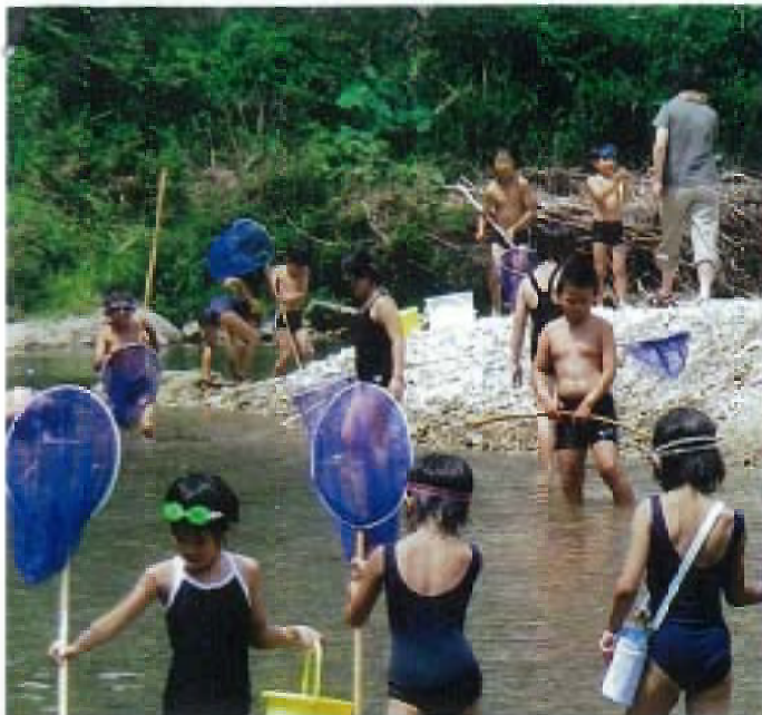
写真1 生野公民館サマースクール