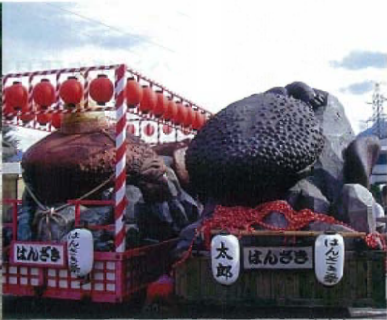
写真2 真庭市ハンザキ祭りのオオサンショウウオ