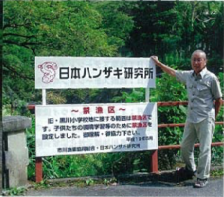
写真4 待望の看板が